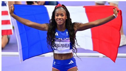
Cyrena SAMBA MAYELA, seule médaillée olympique française de l'athlétisme. (médaille d'argent sur 100m haies.